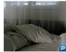
Zu laut im Bett: Die Nachbarin reichte eine Klage ein (Symbolbild)

Mit einer Nachbarn-Klage wegen zu lauter Sexgeräusche hat sich das Amtsgericht Wennigsen bei Hannover (D) beschäftigt. In einem minuziösen Lärmprotokoll hatte die Klägerin aufgeführt, wann das Paar in der Etage unter ihr sich miteinander vergnügte.